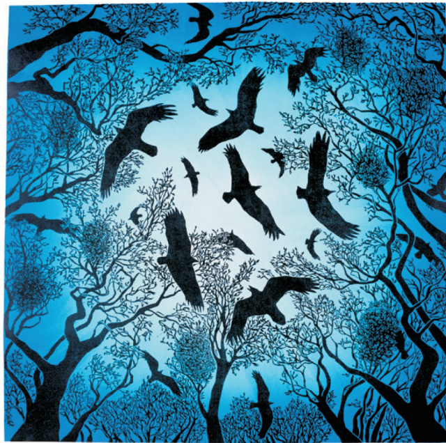
„In das Blaue“, Linol 100/100 cm