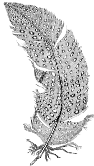
„Perlhuhnfeder“, Linol, 150/75 cm

Wir laden Sie und Ihre Freunde herzlich ein zur Vernissage am Freitag, den 07. Oktober von 19.00 bis 21.00 Uhr, in Anwesenheit der Künstlerin